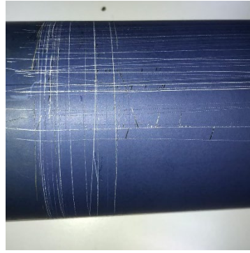
Blue Light de nueva construcción