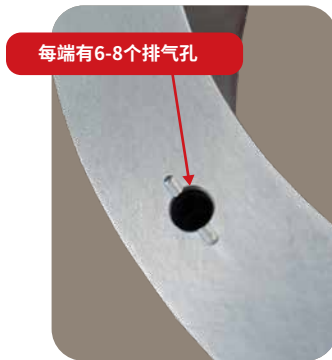
图1:用线标出的排气孔