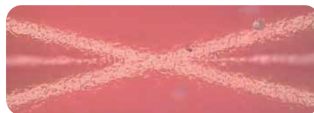
nyloprint® WS 73