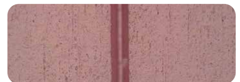
nyloprint® WS 73 Digital

Für weitere Informationen stehen wir Ihnen gerne zur Verfügung.