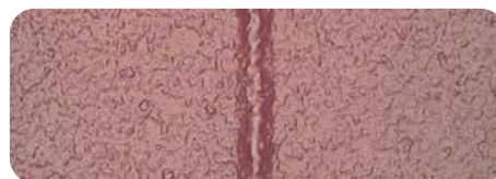
nyloprint® WS 73