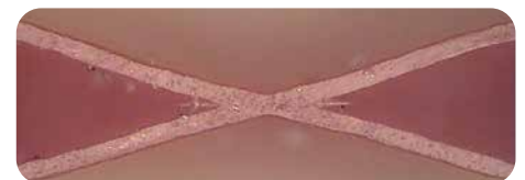
nyloprint® WS 73 Digital